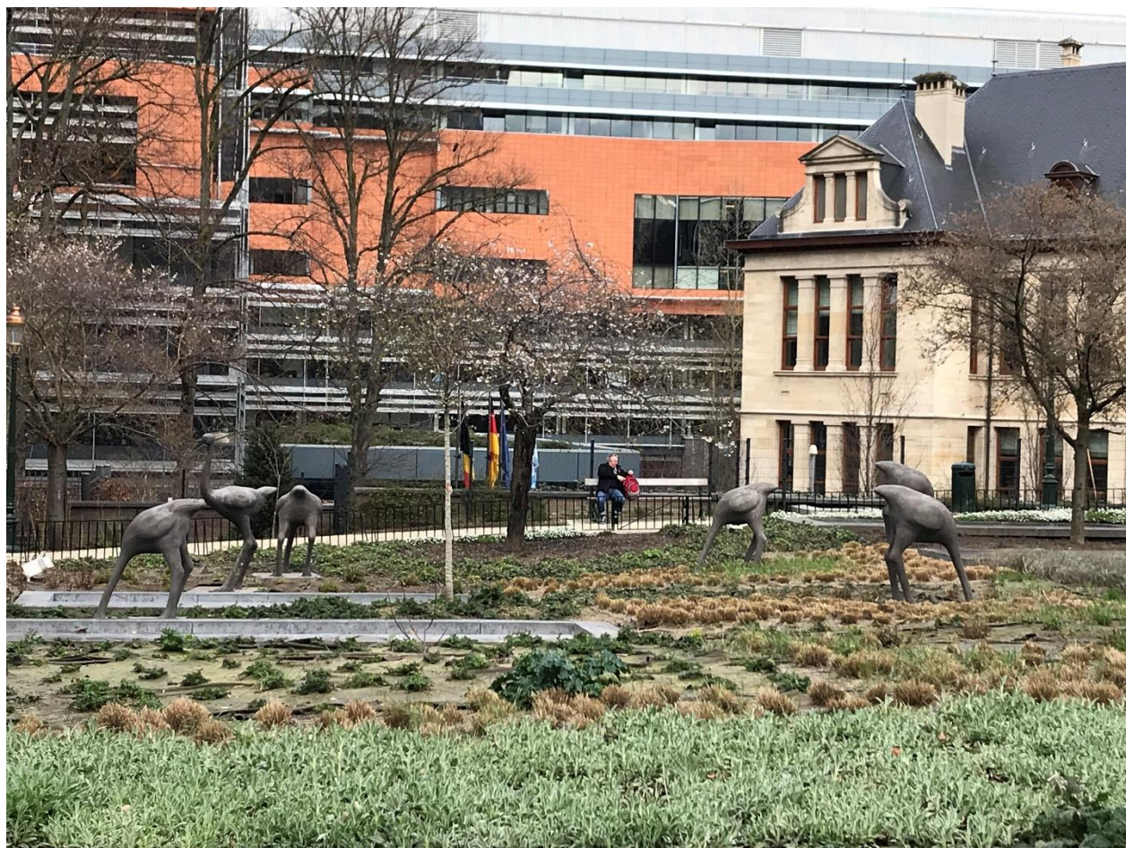
Konstverk i Leopold (sic!) - parken bakom EU-parlamentet. Bitande ironi, men det är uppenbarligen en och annan politiker som sticker huvet i sanden.

Det visades en film om kampen. Jag är glad att vara här. 2006 var kolbrytning i Mexiko som på 50-talet här hos er. 3000 personer dog under 100 år i gruvorna. Det var normalt att gruvarbetare dog. Man skyllde på att gruvarbetarna varit oförsiktiga. 2006 exploderade gruvan efter att man skrivit under ett avtal om arbetsvillkoren mm. Det var så mörkt i gruvan om du förlorar din hjälm med ljus, så ser du inte nåt. I smågruvor finns åtminstone en livlina men inte ens det fanns inte här. Vi band fast ett glas riktat åt ett visst håll för att veta vilket håll du var på väg – in eller ut ur gruvan. Kvinnorna visste inget om hur männens arbete skedde i gruvorna. Det fanns mycket korruption men inspektörerna kördes ut. Kanske blir det första året som vi inte har något dödsfall. Tack till Spanien, Italien och Portugal.